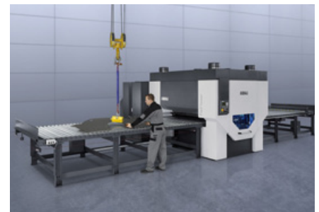
Die Teilrichtmaschine Flatmaster120 verfügt über Funktionen, wie das Richtwalzen Schnellwechselsystem und integrierter Richtspaltenregelung.